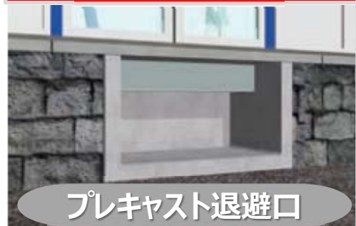
プレキャスト退避口