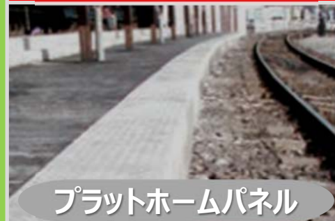
プラットホームパネル