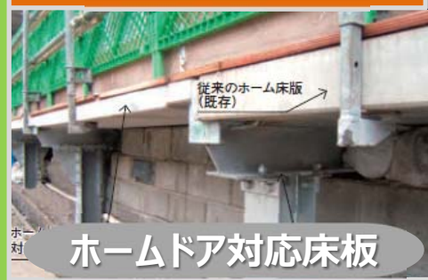
ホームドア対応床板